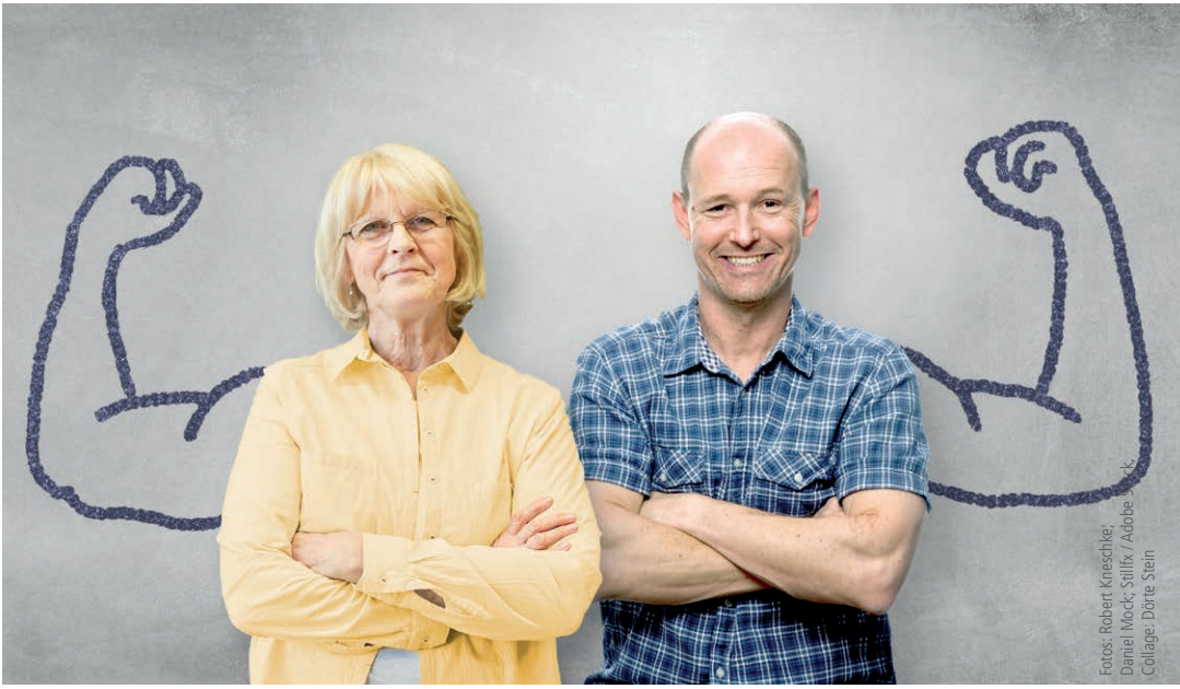
Fotos: Robert Kneschke; Daniel Mock; Sillix / Adobe Collage: Dörte Stein

MENTOpro – Gemeinsam für eine starke Belegschaft